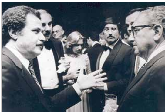
作者与美国前国务卿亨利·基辛格。