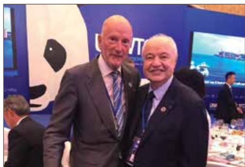
作者与保加利亚国王西蒙二世合影。