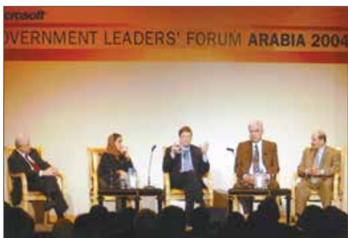
作者与比尔·盖茨 (中间)、卢布娜·卡西米、阿里·萨利赫·萨勒希及艾哈迈德·纳齐夫博士在开罗参加微软阿拉伯政府领导力论坛合影。