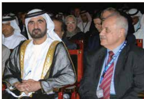
作者与阿拉伯联合酋长国副总统、总理兼迪拜酋长穆罕默德·本·拉希德·阿勒马克图姆会面。