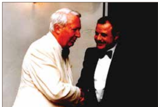
作者与英国首相爱德华·希思合影。