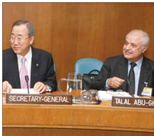
作者与潘基文在全球契约会议上的合影 - 纽约。