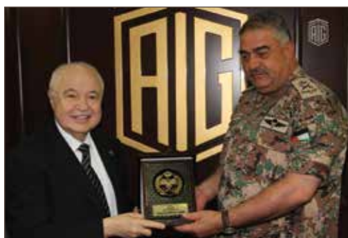
作者与约旦武装部队联合参谋长马哈茂德·费里哈特上将合影。