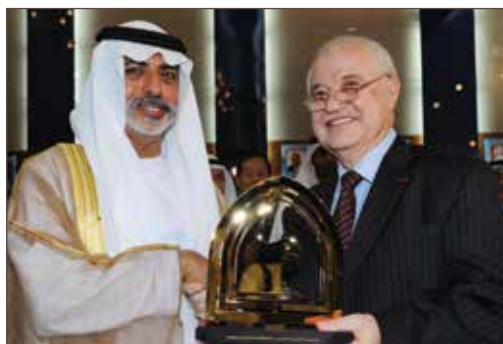
作者与阿联酋高等教育与科研部长，尊敬的谢赫·纳希扬·本·穆巴拉克·阿尔纳哈扬合影。