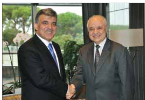
作者与土耳其总统阿卜杜拉·居尔合影。