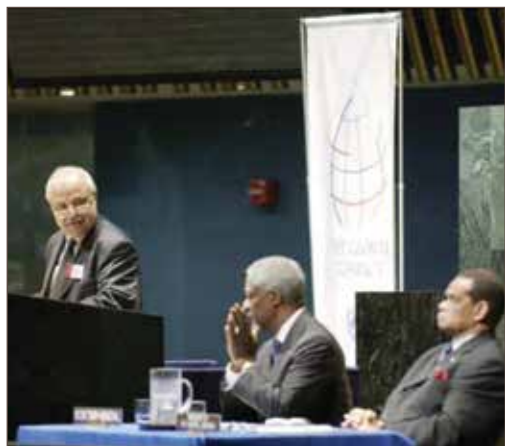
作者与科菲·安南在联合国总部合影 - 纽约。