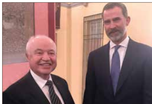
作者与西班牙国王费利佩六世合影。