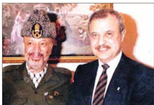
作者与巴勒斯坦总统亚西尔·阿拉法特合影。