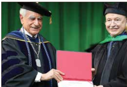
作者荣获美国黎巴嫩大学 (Lebanese American University) 授予的人文学荣誉博士学位。