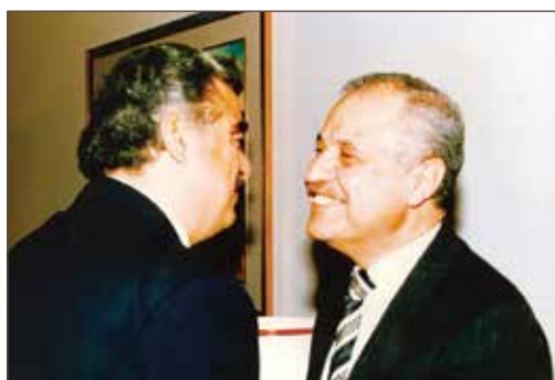
作者与黎巴嫩总理拉菲克·哈里里合影。