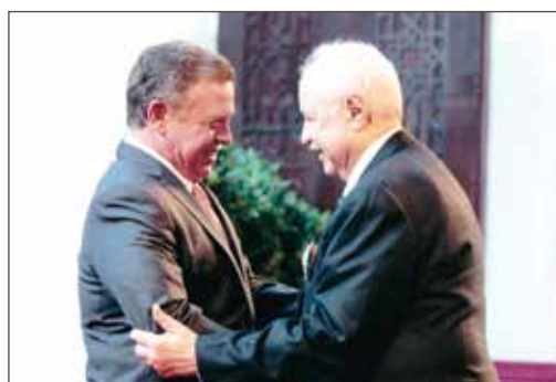
约旦哈希姆王国国王阿卜杜拉二世亲自授予作者一级独立勋章——2016年。