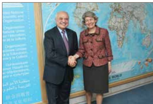
作者与联合国教科文组织总干事伊雷娜·博科娃合影——地点：巴黎联合国教科文组织总部。