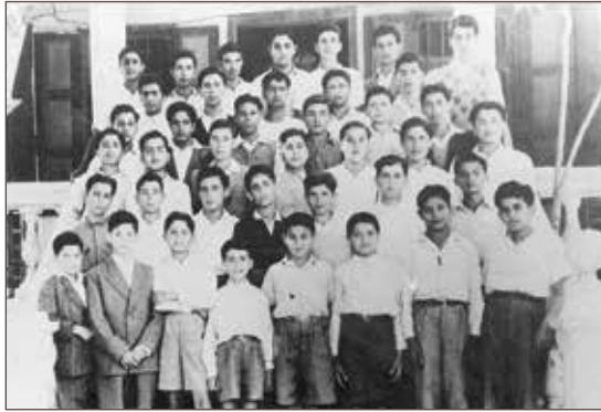
作者与同事们在 Al-Maqasid 学校 - 贝鲁特。