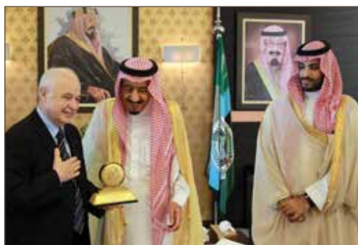
作者与沙特阿拉伯国王萨尔曼·本·阿卜杜勒阿齐兹及王储穆罕默德·本·萨勒曼合影。