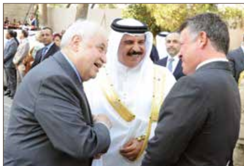
作者与阿卜杜拉二世约旦国王陛下及哈马德·本·伊萨·哈利法国王陛下合影。