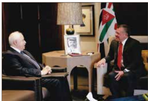
作者与约旦国王阿卜杜拉二世会面。