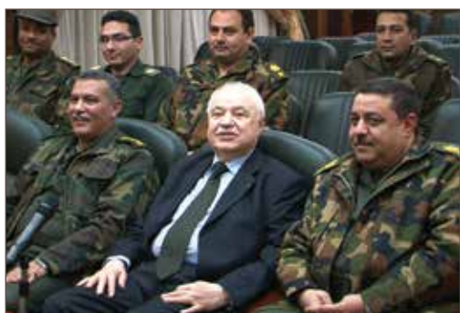
作者与多位埃及武装部队高级军官合影。