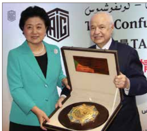
作者与中华人民共和国副总理 刘延东阁下 人民广场。