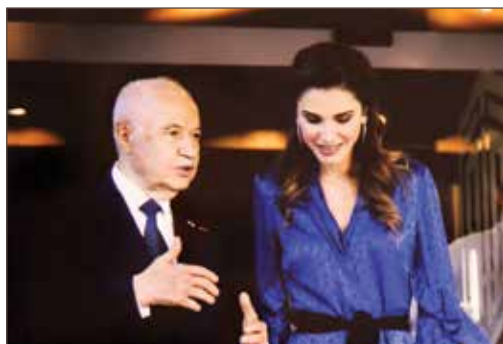
作者与约旦王后拉妮娅·阿卜杜拉殿下合影。