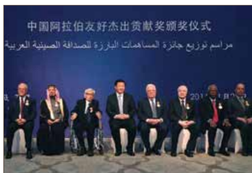
中华人民共和国国家主席习近平表彰作者在促进中阿关系方面的贡献。