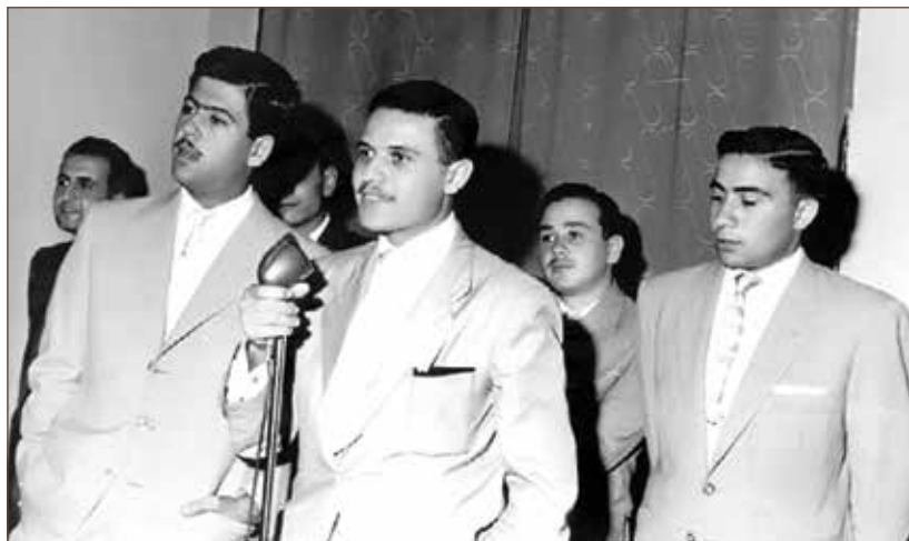
作者在贝鲁特美国大学演讲。

因此，实现阿拉伯复兴虽非不可能，却也绝非易事。在当前国际惯例下，变革已成为必然。必须有一个涵盖广泛的阿拉伯复兴计划，由意识引领，由正义保护，并由青年之手建设。未来不是等待而来的，而是通过意志、知识与行动去创造、去争取的。