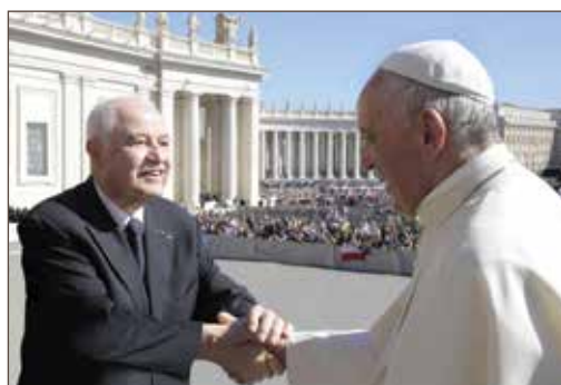
作者与教宗方济各合影。