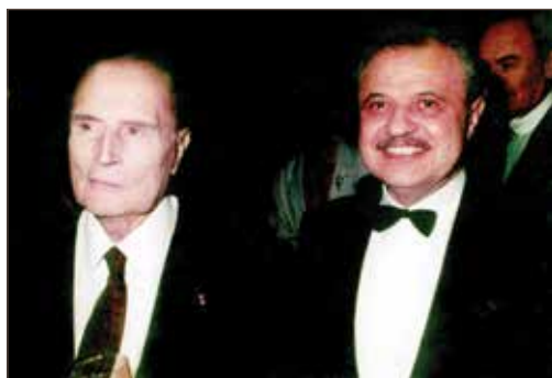
作者与法国总统弗朗索瓦·密特朗合影 - 巴黎。