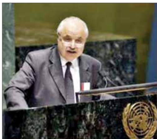
作者在联合国讲台上