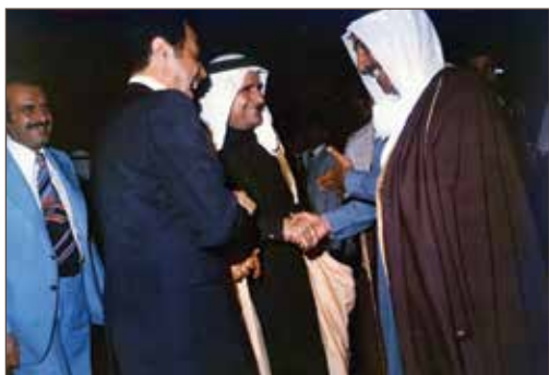
作者与科威特现任埃米尔、时任外交大臣萨巴赫·艾哈迈德·贾比尔·萨巴赫亲王，以及约瑟夫·易卜拉欣·阿尔-加尼姆会面，科威特 - 197[年3月26日]。