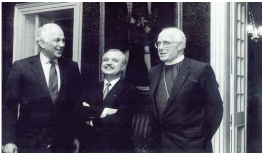
作者（中间）与坎特伯雷大主教（右）及埃弗琳·德·罗斯柴尔德（左）在圣詹姆斯宫，共同启动基于三大宗教的道德宪章倡议。