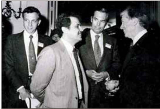
作者与美国前总统吉米·卡特。