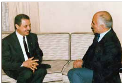
作者与侯赛因·本·塔拉勒国王合影。