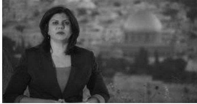
شيرين أبو عاقلة

الأدوار، التي تبث عبر الأثير، وتظهر على شاشة التلفاز، بل هناك العديد من النساء الفلسطينيات اللواتي يعملن من وراء الكواليس، كالمصورات، والمخرجات، ومهندسات الصوت، وغيرهن.